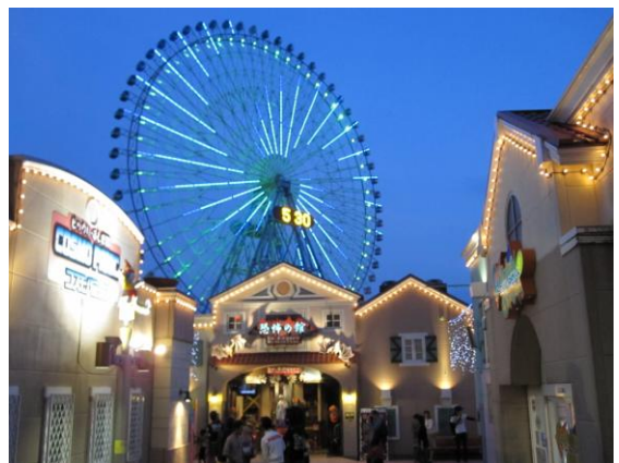
みなとみらいの夜景

「キャッツ」の内容は、今更ここで書くまでもありません。個性ある猫たちの世界を、歌と踊り、そして体じゅうで表現する役者たちを堪能しました。この秋に8千回の上演を記録しましたが、継続することの意味は洗練された舞台全体に溢れて、あらゆる事柄に感じることができます。利用者それぞれの詳細な感想は聴いていませんが、「また観たい」「涙が出てきた」「すごかった」と言っていました。